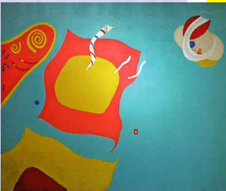
「そっとつかまえて (1967年)」 野上 祇麿 洋画