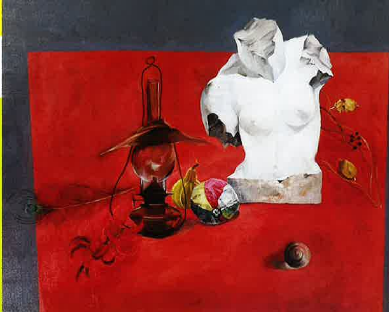
「トルソのある景 (赤い卓の景)」 広田 揚二 洋画